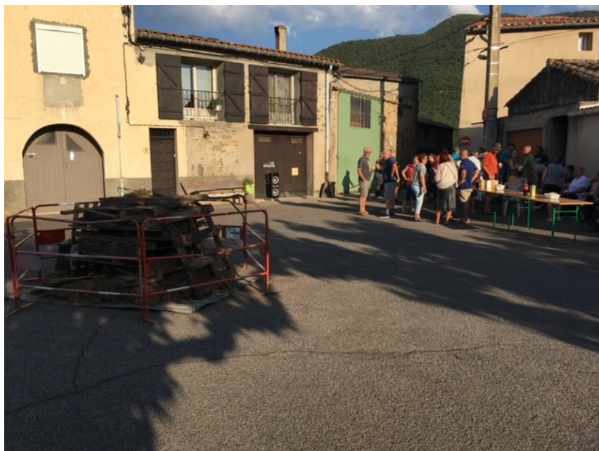
Photo n°14 : Apéritif et préparation du feu pour la fête de la St Jean