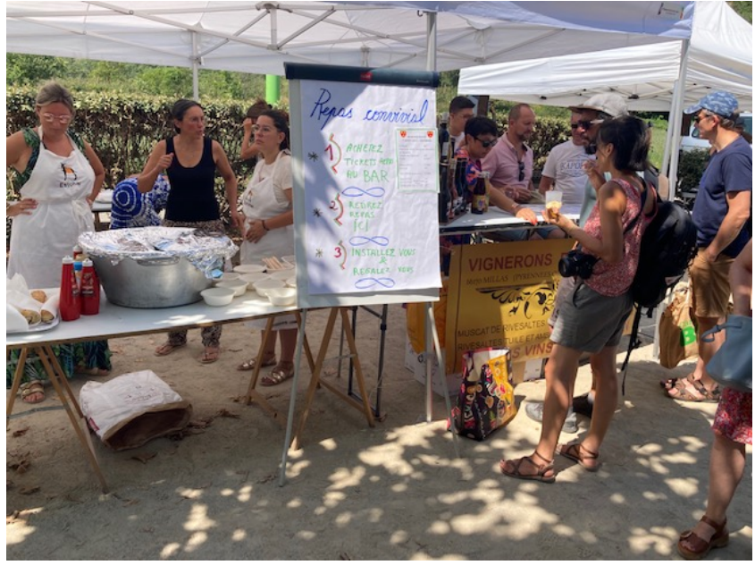
Photo n°6 : Stand de distribution de repas lors d'un marché festif à Estover