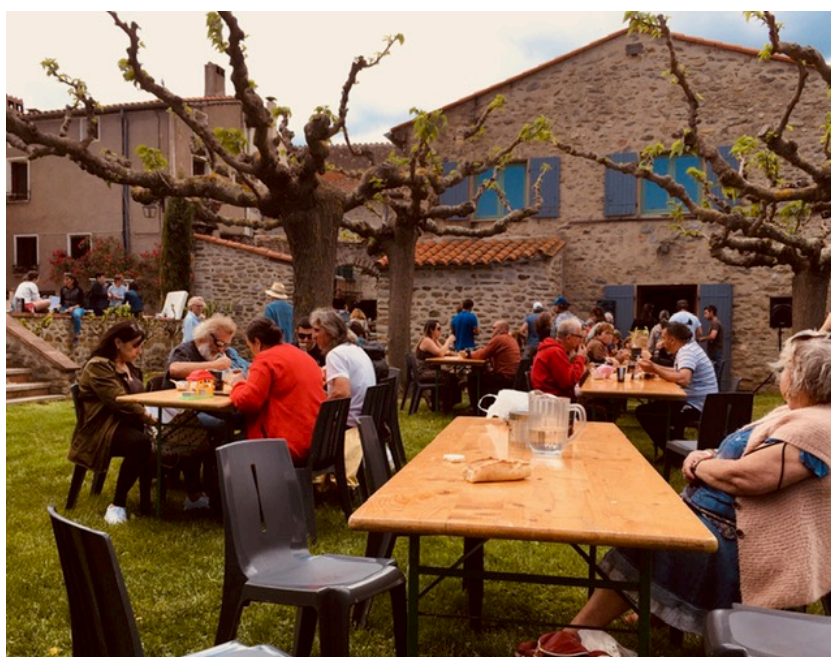
Photo n°4 : déjeuner à la salle des fêtes d'Espira pendant le vide grenier