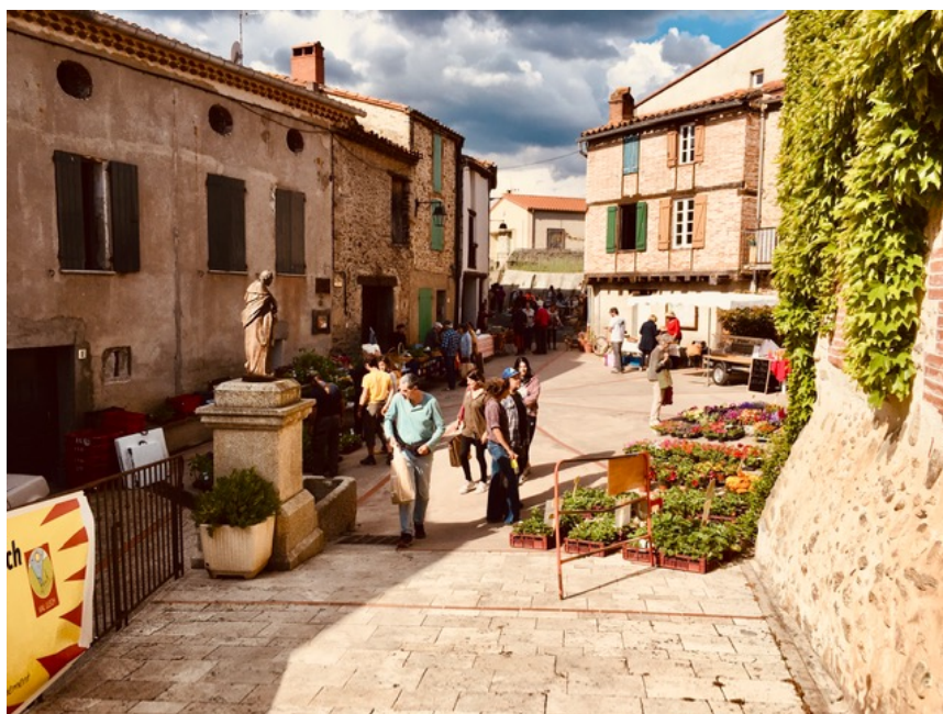
Photo n°3 : marché de producteurs à Espira pendant le vide grenier